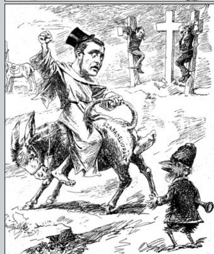
Karikatúrák az új miniszterelnökről, az új pénz, a korona által megkoronáztatott Wekerle Sándorról, aki friss stallumja mellé megkapta a liberálisok politikai örökségét is. (Üstökös, 1892)